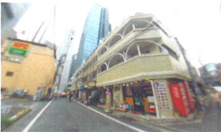
■ 外観 ■