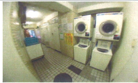
■ 1Fコインランドリー ■