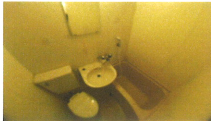
■ UB ■