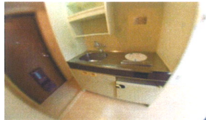
■ K ■