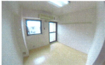
■ 室内 ■