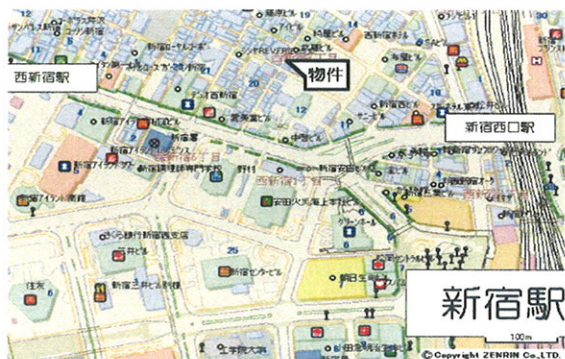
■ 現地案内図 ■