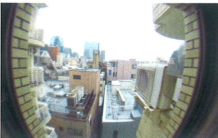
■ 窓からの眺め ■