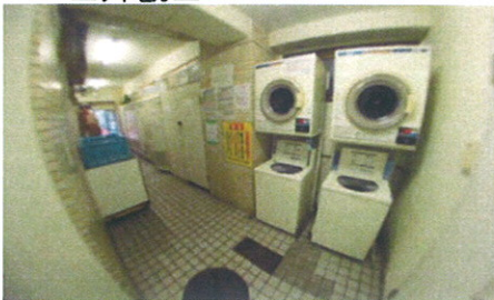
■共用コイソウトリ■