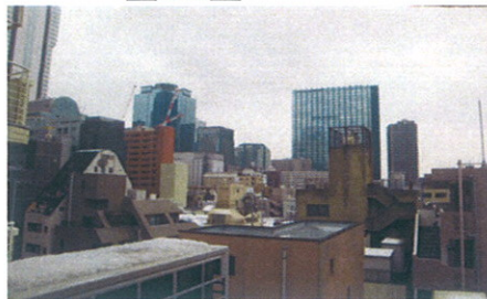
■バルコニーからの眺望■