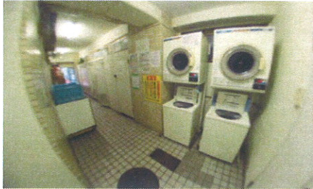
■共用コイソナトリ■