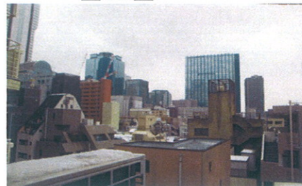
■バルコニーからの眺望■