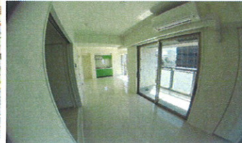
※図面と現況に相違がある場合は現況優先と致します。