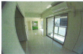
■室内 (9F) ■