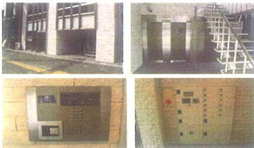
■1階部分■ インターホン 郵便受・宅配BOX