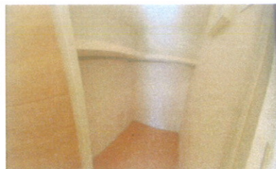
W I C