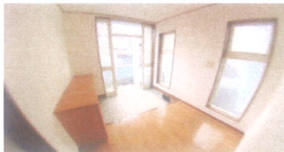
↑ ■ 玄関 ■ ↓ ■ K ■