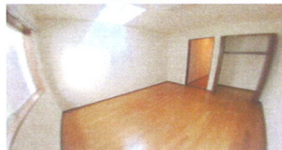
■ LD ■ ■ 洋室5.5帖 ■