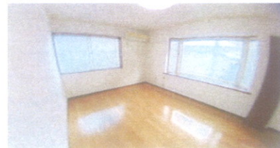
↑ ■ 洋室6帖 ■ ↓ ■ 洋室5帖 ■