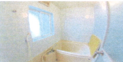
↑ ■ 浴室 ■ ■ 現地案内図 ■