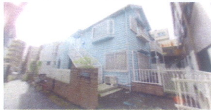
↑ ■ 外観 ■ ↓ ■ 小屋裏 ■