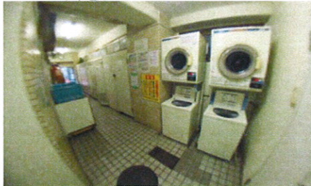
■共用コイソウトリ■