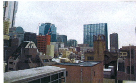
■バルコニーからの眺望■