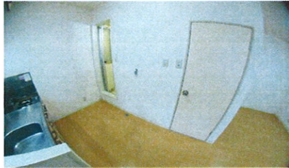
■洗濯機置スペース■