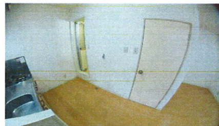
■洗濯機置スペース■