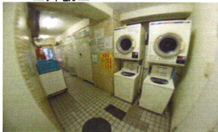
■共用コイソラトリー■