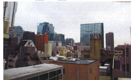
■バルコニーからの眺望■