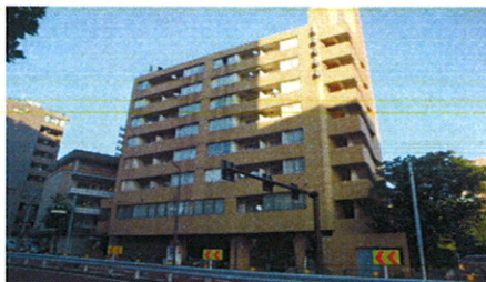
■ 外観 ■