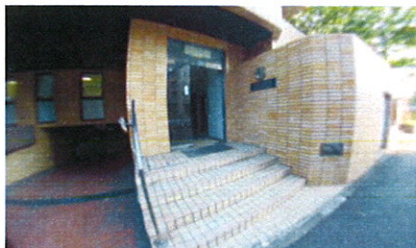
■ 共用玄関 ■