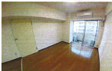
■ L ■