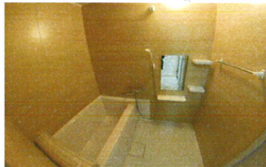
■ 浴室 ■