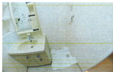
■ 洗濯脱衣所 ■