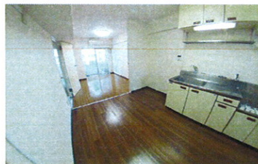
■ DK ■