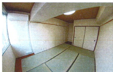
■ 和室 ■