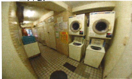
■共用コイソトリー■