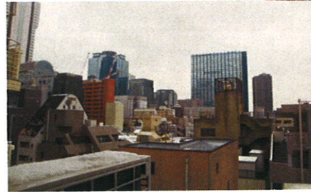
■バルコニーからの眺望■