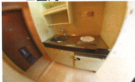
■K■冷蔵庫はありません