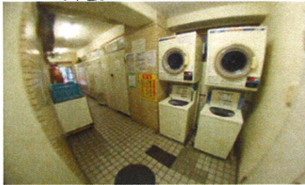
■共用コインランドリー■