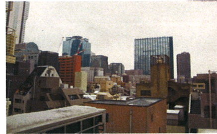
■バルコニーからの眺望■