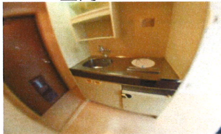
■K■冷蔵庫はありません