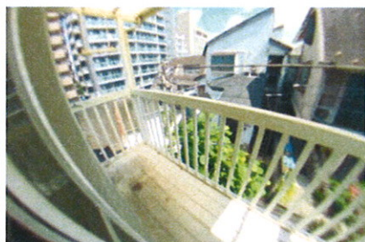
■洗濯機置場・バルコニー■