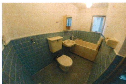
■洗濯機置場・WC・浴槽■