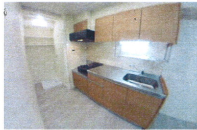
■キッチン・洗濯機置場■