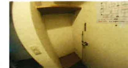
■ 室内棚 ■