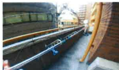
■ 共用物干場 ■