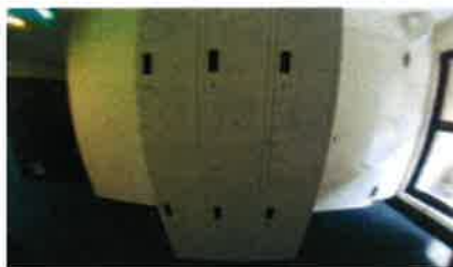
■ ロッカー ■