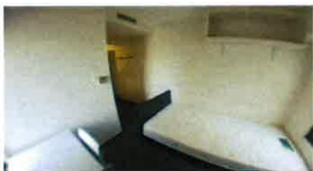
■ 室内 ■