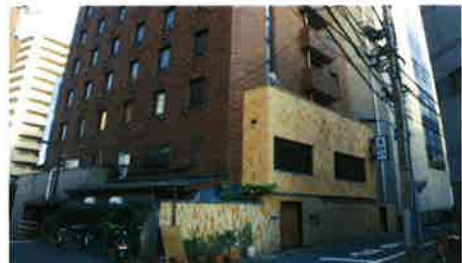
■ 外観 ■