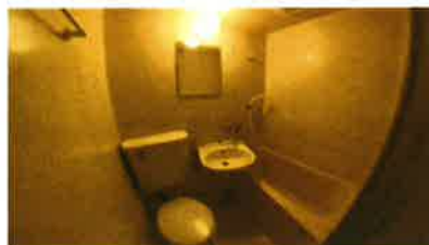
■ UB ■