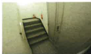
■専用階段・物件入口■