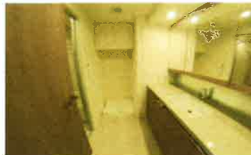
洗面・洗濯機置場